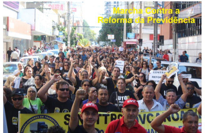
Marcha Contra a Reforma da Previdência

Para confirmar a força de mobilização da cidade, às 9h da manhã o calçadão de Canoas já havia sido tomado por trabalhadores e trabalhadoras que se preparavam para uma grande marcha. Convocada pelo Comitê Sindical Popular Contra a Reforma da