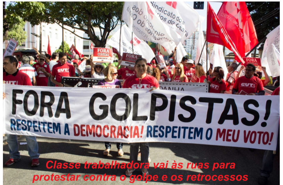
Classe trabalhadora vai às ruas para protestar contra o golpe e os retrocessos

O ex-presidente Lula, alvo de uma ação coercitiva em março deste ano, é citado nas gravações quando Machado fala da “cagada dos Procuradores de São Paulo”, referindo-se à ação que gerou um pedido de prisão para Lula. Jucá, por sua vez, assume que toda a movimentação foi para inviabilizar Lula como ministro. “Os caras fizeram