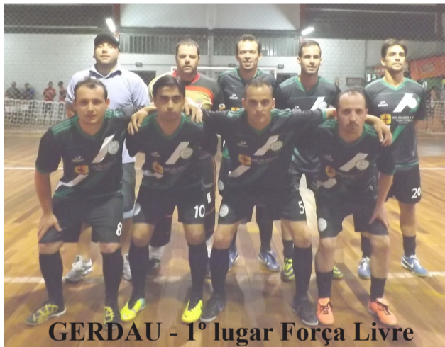
GERDAU - 1º lugar Força Livre