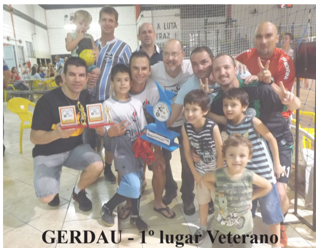
GERDAU - 1º lugar Veterano

Obrigado a todos e todas que prestigiaram o nosso Campeonato e colaboraram para ser um grande evento, temos a certeza que em 2015 será ainda melhor.