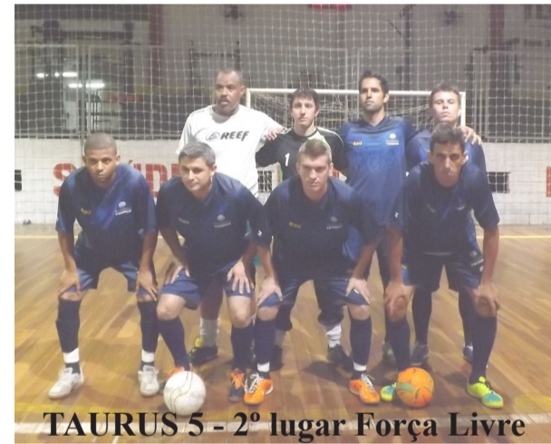
TAURUS 5 - 2º lugar Força Livre