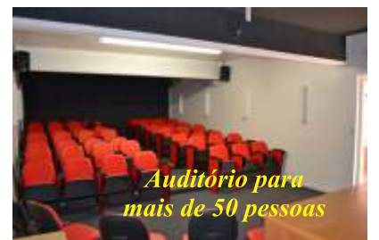
Auditório para mais de 50 pessoas

diminuir os custos com ligações telefônicas tanto para o sindicato como para o associado e/ou dependente. Outro destaque foi a construção de um auditório para realização de reuniões, assembleias e eventos culturais e de formação.