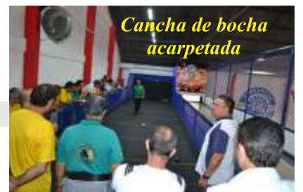
Cancha de bocha acarpetada

eventos coletivos, com churrasqueira, ar-condicionado, televisores e novos banheiros. Também foram instaladas as novíssimas cancha de bocha e pista de boliche totalmente automatizada e um espaço destinado para cobertura jornalística