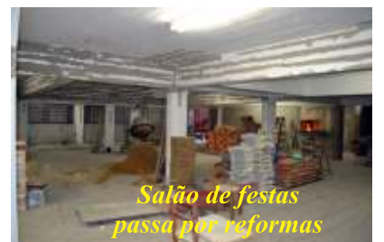
Salão de festas passa por reformas

do barulho para fora e evitar a poluição da fumaça das churrasqueiras, problemas históricos que estava inviabilizando o uso daquele importante espaço de lazer e integração.