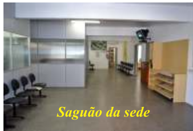
Saguão da sede

idosos e cadeirantes, a sede recebeu rampas de acesso desde a calçada até as salas. Além de novas instalações, equipamentos foram adquiridos para agilizar o atendimento. Em destaque, a informatização e internet de banda larga e a colocação do fone 0800.6024955 para