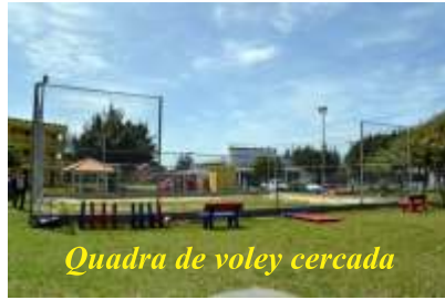
Quadra de voley cercada

Nos últimos dois anos, a direção do Sindicato dos Metalúrgicos resolveu investir grande parte dos recursos para renovar o patrimônio da categoria, sem esquecer de investir na luta, na formação e na assistência