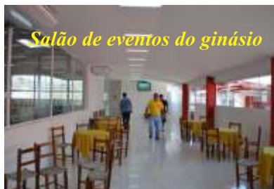
Salão de eventos do ginásio

de eventos esportivos na quadra de esportes.