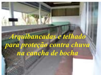
Arquibancadas e telhado para proteção contra chuva na cancha de bocha

médica, odontológica e jurídica dos associados e dependentes.