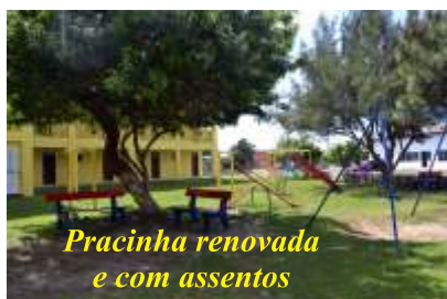
Praçinha renovada e com assentos

tes nos 61 apartamentos e na área do camping. Lá foi feita a pintura geral do prédio (interna e externa), a colocação de revestimentos cerâmicos nos chuveiros externos, a instalação de boxes para veículos, a colocação de forro no bar, o cercamento da