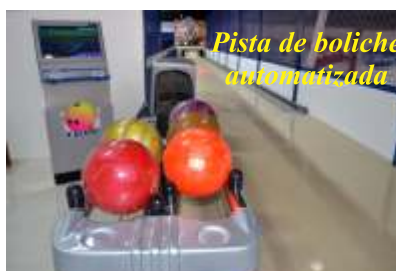
Pista de boliche automatizada

Mais recentemente, entre o segundo semestre do ano passado e o primeiro trimestre deste ano, foi a vez do ginásio receber investimentos, principalmente no andar acima das arquibancadas. Ali foram construídos espaços para realização de festas e outros