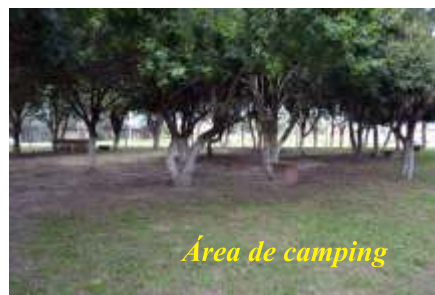
Área de camping

Na prestação de contas ao lado, vimos que uma boa quantia de recursos foram investidos na estrutura da colônia de férias, que fica aberta durante todo o ano - e não só no veraneio - para receber os associados e seus dependen-