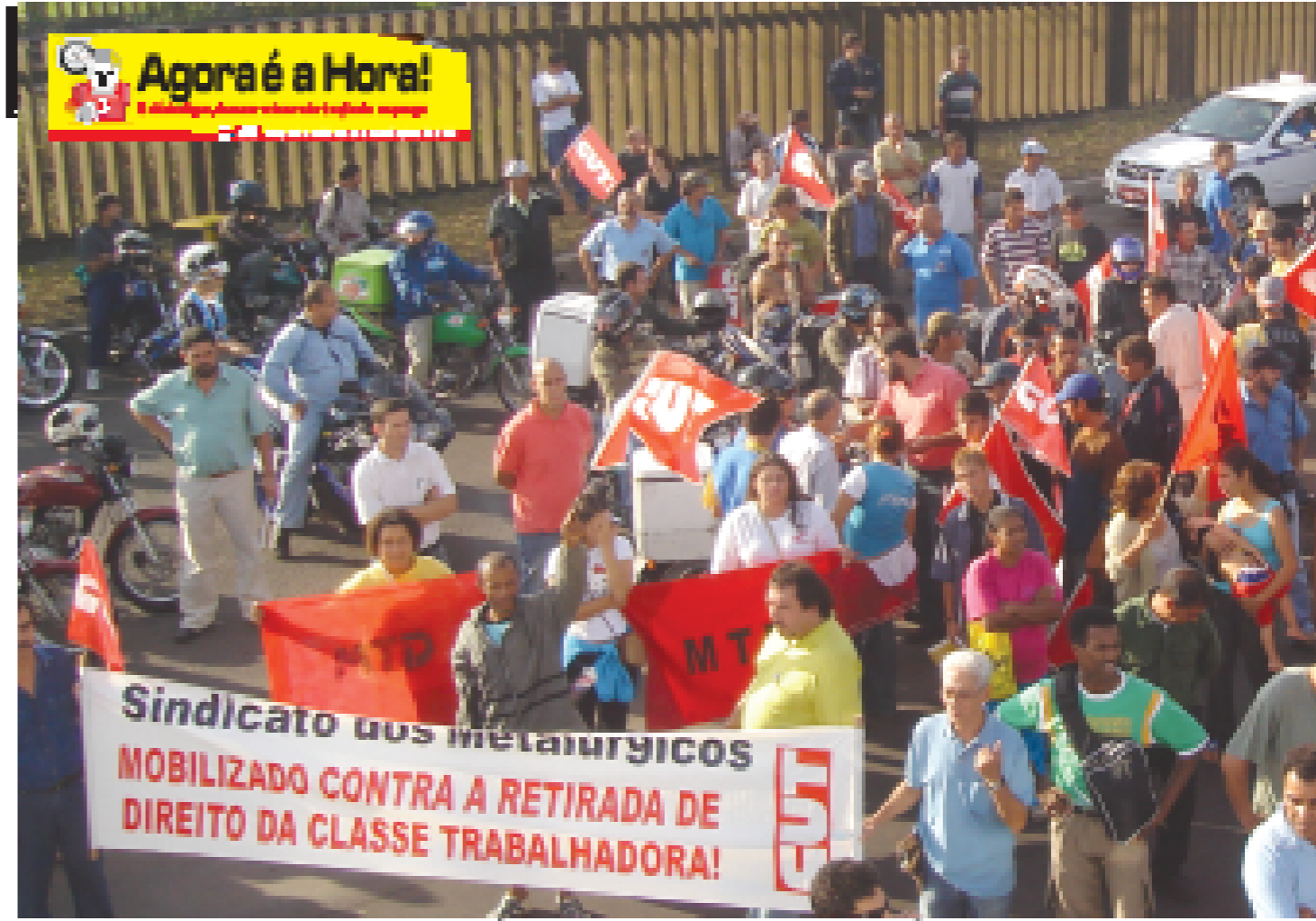
Em uma das manifestações da campanha, os trabalhadores exigem a valorização do trabalho e reajuste salarial.

N ão dá mais para esperar! O salário é agora o companheiro. Está na hora de um salário justo e digno. O salário real e realça o trabalho. A luta dos metalúrgicos é a luta por um salário digno. Não dá mais para esperar - não dá mais para esperar - não dá mais para esperar.