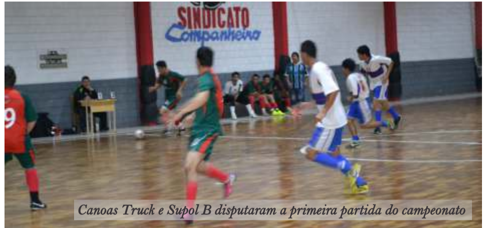
Canoas Truck e Supol B disputaram a primeira partida do campeonato

Uma semana antes do evento está previsto um treino aberto ao ar livre à tarde no centro de Canoas com os atletas, ainda sem data e horário definidos. Os ingressos para o 1º Valiant Fighters MMA Canoas estarão disponíveis para compra a partir de 1º de novembro e custam R$ 20,00 a arquibancada, R$ 30,00 a cadeira e R$ 50,00 o espaço VIP. Os pontos de venda de ingressos são Academia World Fitness, Lojas QFera, Loja MMA Canoas, Dia Supermercado (Bairro Mato Grande). Marque na sua agenda e venha conferir o MMA de Canoas!